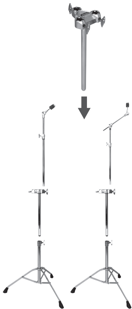
Стойка для тарелок